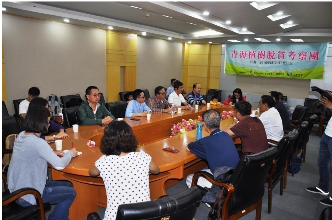
考察團召開了交流會議