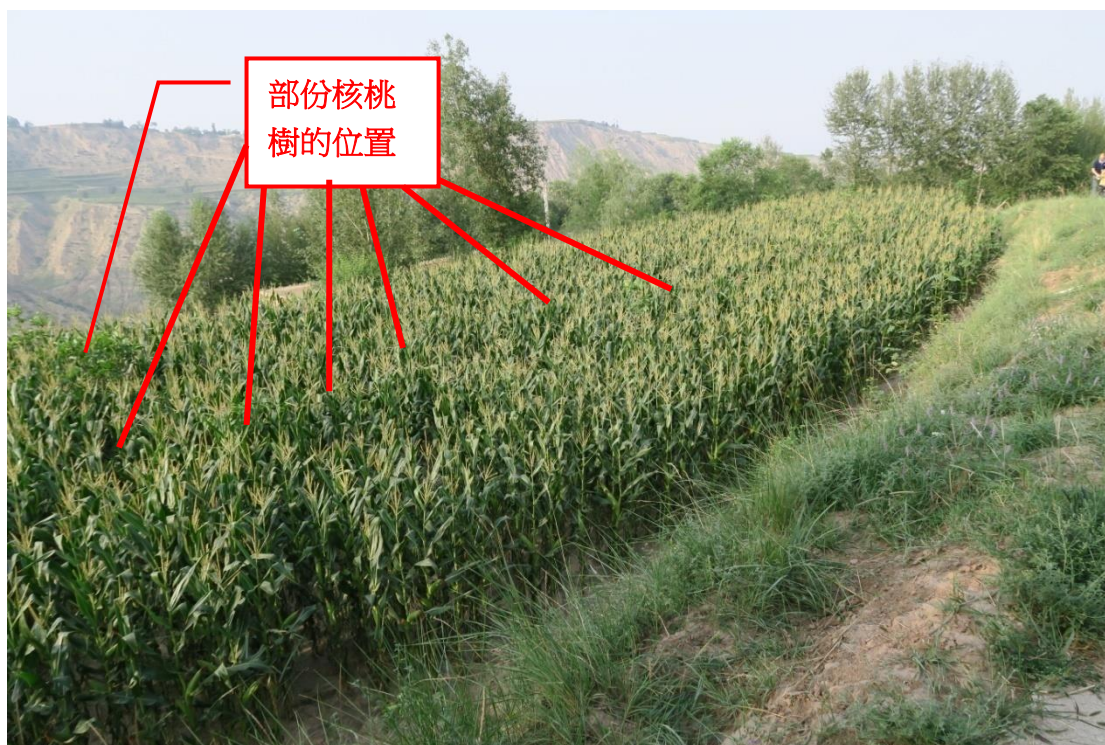
為了善用耕地，部份農戶將核桃樹的樹苗與粟米一起種植，生長情況十分理想