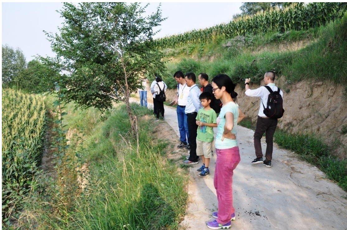
團員在視察核桃樹樹苗的生長情況