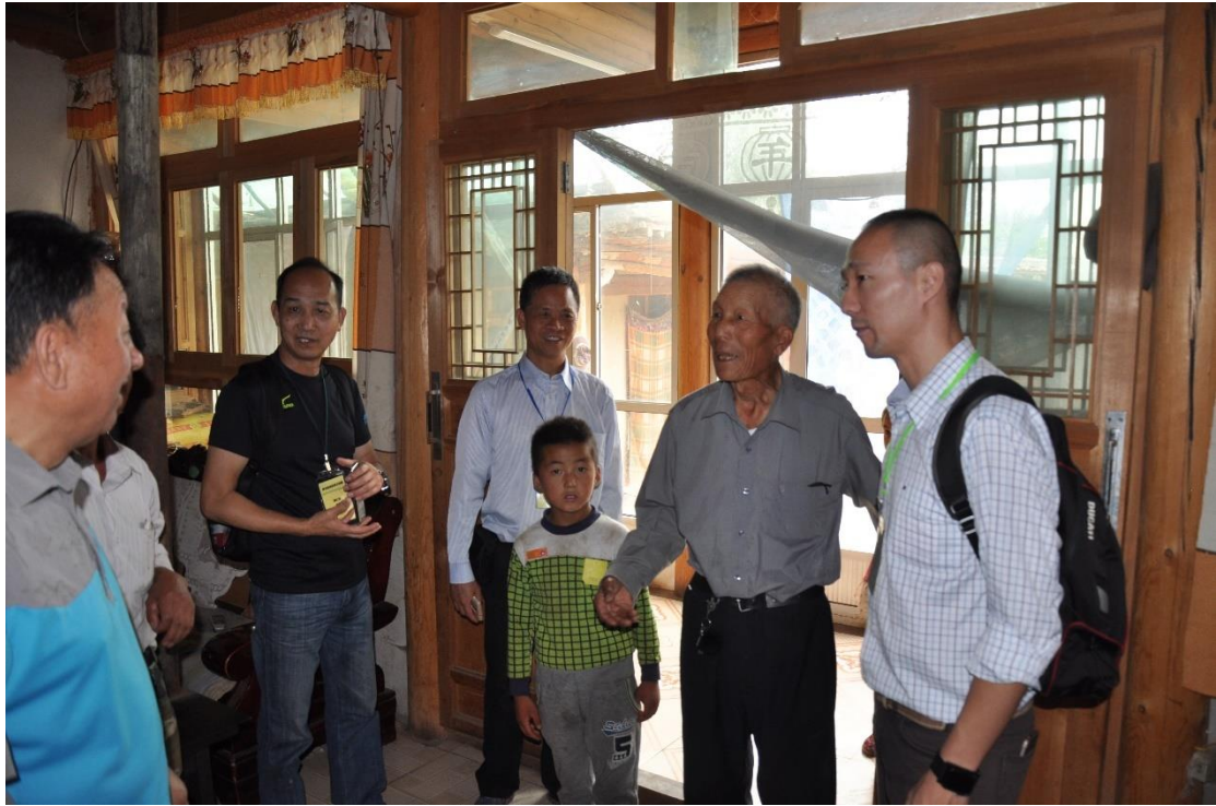
團員前往貧困戶家中參觀及了解他們的生活