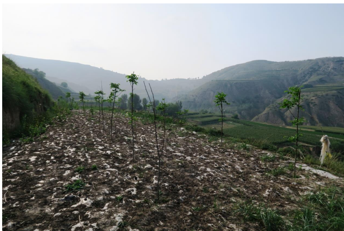
另一耕地上的核桃樹樹苗生長情況亦十分理想