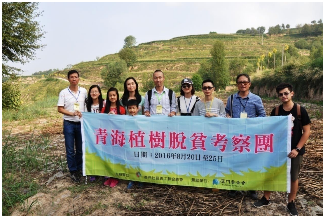
部份考察團成員在種植花椒樹樹苗的耕地前合影