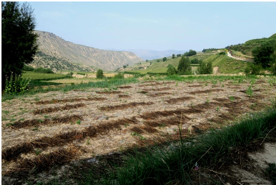
耕地上的花椒樹樹苗生長情況亦不錯