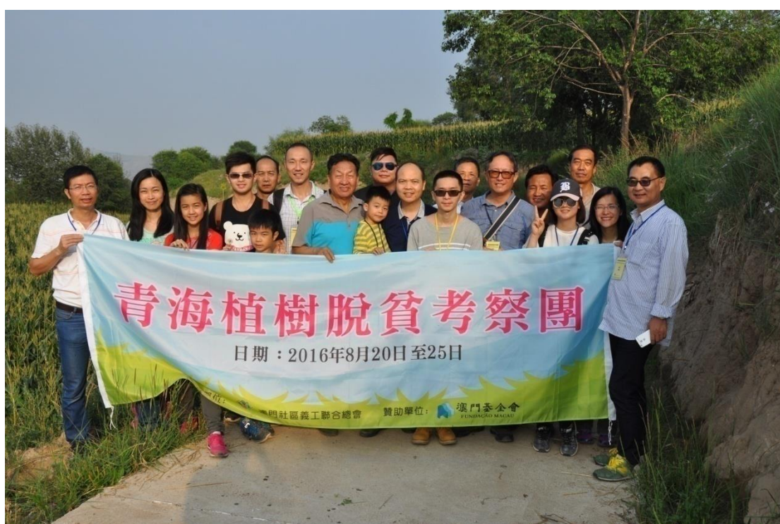
考察團在種植核桃樹的農地前合照